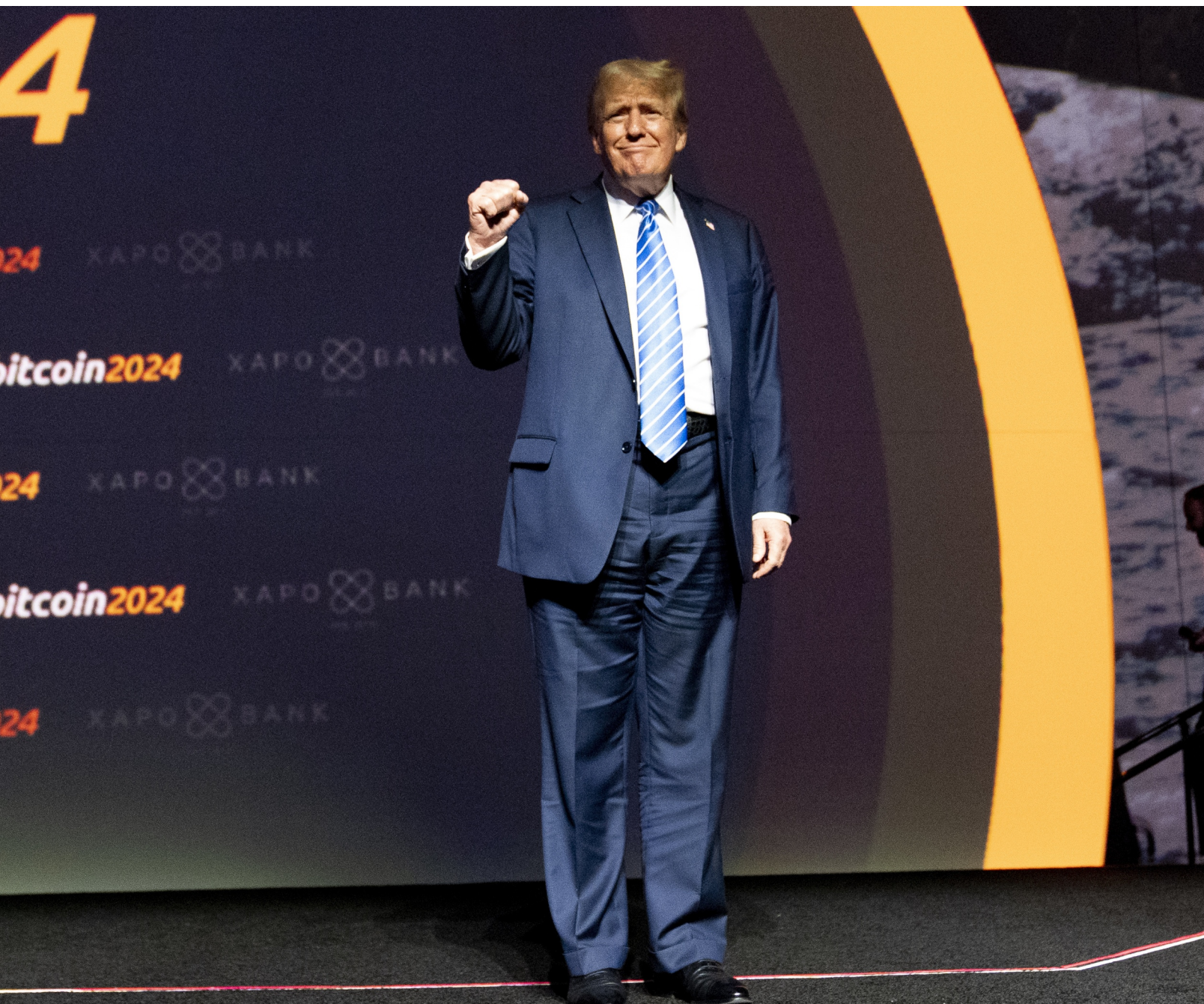
Tijdens zijn campagne belofde Donald Trump om van de Verenigde Staten de "cryptohoofdstad" van de wereld te maken.